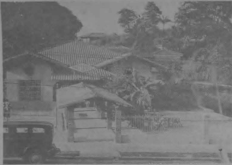
Vista exterior lateral del COMISARIATO ENDARIBA de Bella Vista, con su jardínito poblado de mesitas para tomar helados durante las noches claras.

Regocija íntimamente al espíritu confrontar que la mentalidad comercial de nuestros comerciantes va cambiando notablemente y que ella va dando alientos a nuevas modalidades en los negocios que traen aparejados ventajas y progresos notables para la comunidad, en todos los órdenes.