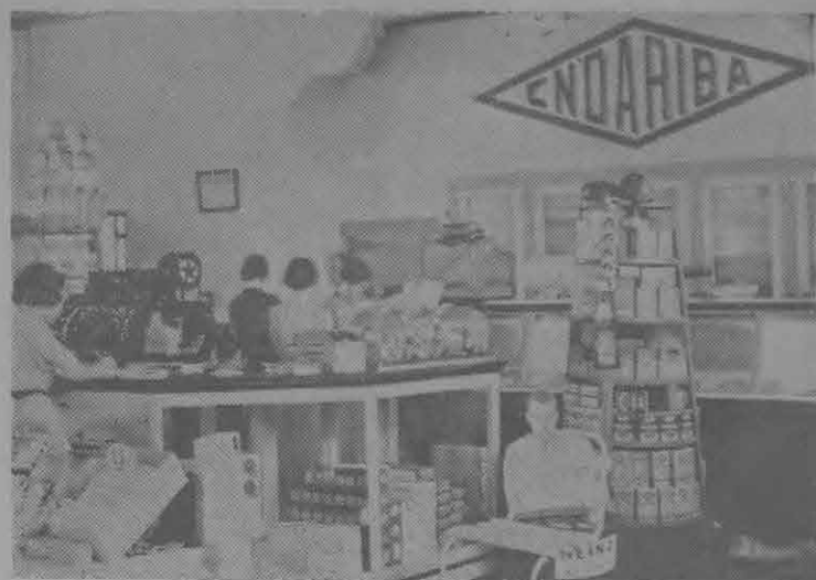
Una de las dependencias interiores del COMISARIATO ENDARIBA de Bella Vista, la Sección de venta de víveres finos.